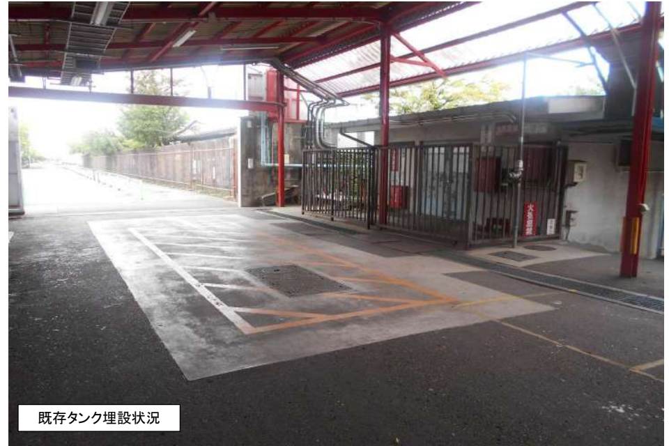
既存タンク埋設状況