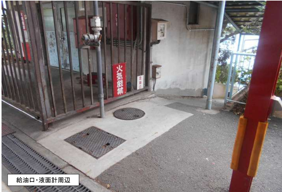
給油口・液面計周辺