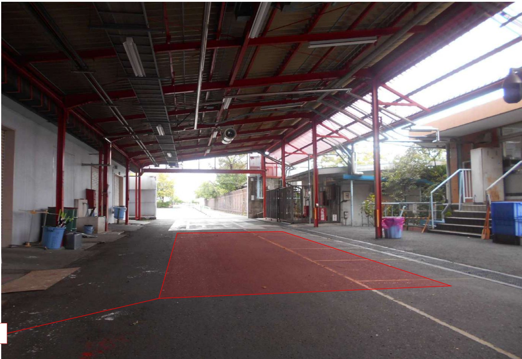
新設タンク埋設予定位置